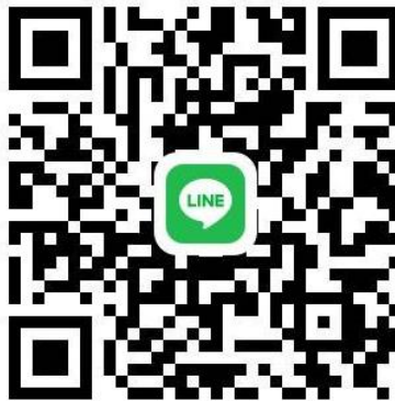
QR Code 1 สำหรับนำส่งแบบตอบรับการเข้ารับการอบรม

๑๐. QR Code 3 ระเบียบหลักสูตรการบริหารความมั่นคงสำหรับผู้บริหารระดับสูง (สวปอ.มส. SML) รุ่นที่ ๕ สมาคมวิทยาลัยป้องกันราชอาณาจักร ในพระบรมราชูปถัมภ์ ประจำปีการศึกษา ๒๕๖๗